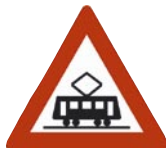
139 - Sporvogn

Mange av sidegatene til trikkogater i Oslo er nå blitt merket med følgende skilt for å minne bilister på at de har vikeplikt for trikken, enten den kommer fra høyre eller venstre.